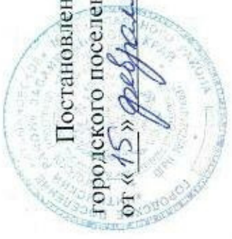
СХЕМА оповещения городского поселения «Атамановское»

Приложение УТВЕРЖДЕНО Постановлением администрации городского поселения «Атамановское» от «15» февраля 2018 г. № 121